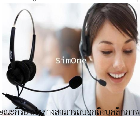
ภาพที่ 2 ลักษณะกิริยาท่าทางที่สามารถบอกถึงบุคลิกภาพของบุคคลได้