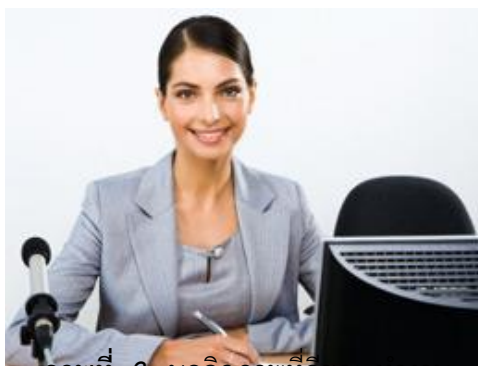
ภาพที่ 3 บุคลิกภาพที่ดีขณะทำงาน