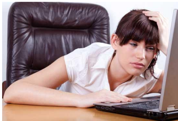
ภาพที่ 4 บุคลิกภาพที่ไม่เหมาะสมขณะทำงาน