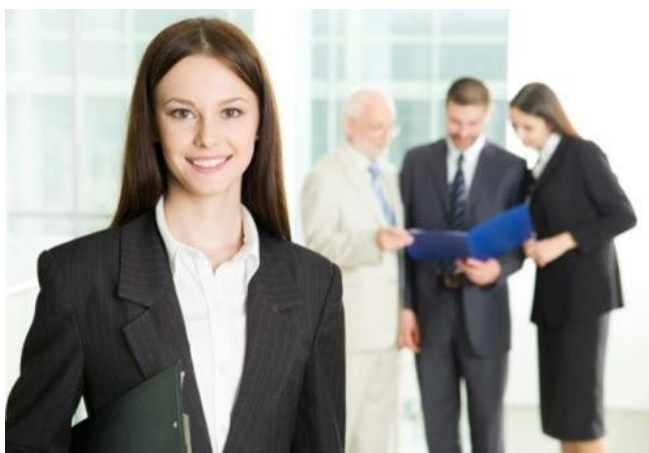
ภาพที่ 1 รูปภาพบุคลิกภาพที่ดีนำไปสู่ความสำเร็จในการปฏิบัติงาน

6. การยอมรับของกลุ่ม (Acceptance) บุคคลที่มีบุคลิกภาพดีจะเป็นที่ชื่นชม นิยมชมชอบ และพึงพอใจเป็นที่ยอมรับของกลุ่มเป็นอย่างดี ยังสามารถเสริมสร้างด้านการปฏิบัติงานไม่ว่าจะเป็นส่วนตัวหรือส่วนรวม